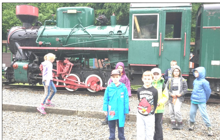
Stacja kolejki wąskotorowej