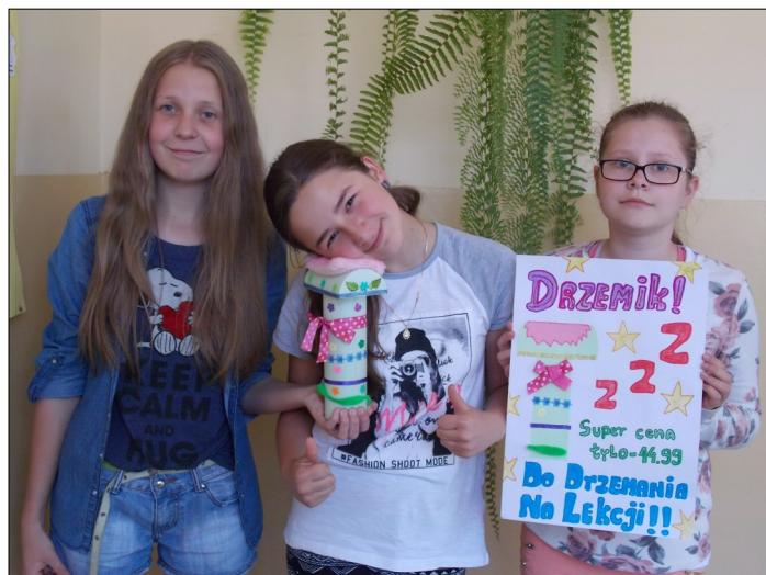
Drzemik-do drzemia na lekcji

Jak się okazało tworzenie reklamy nie jest wcale rzeczą łatwą.