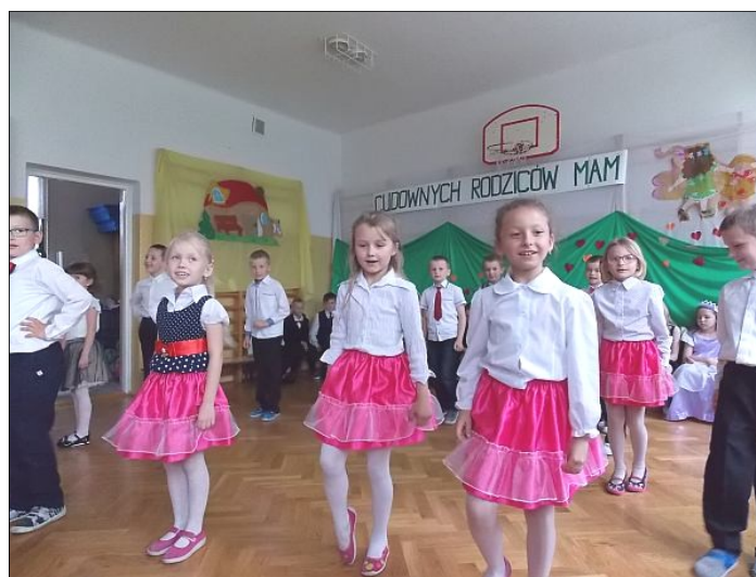
Występ klasy pierwszej