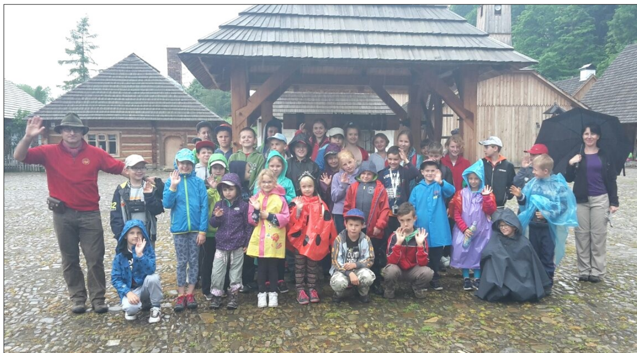
Skansen w Sanoku