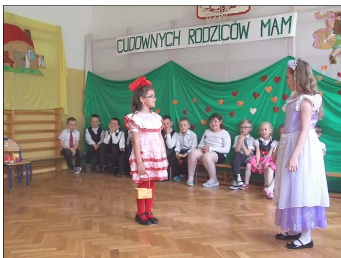
Klasy druga i trzecia