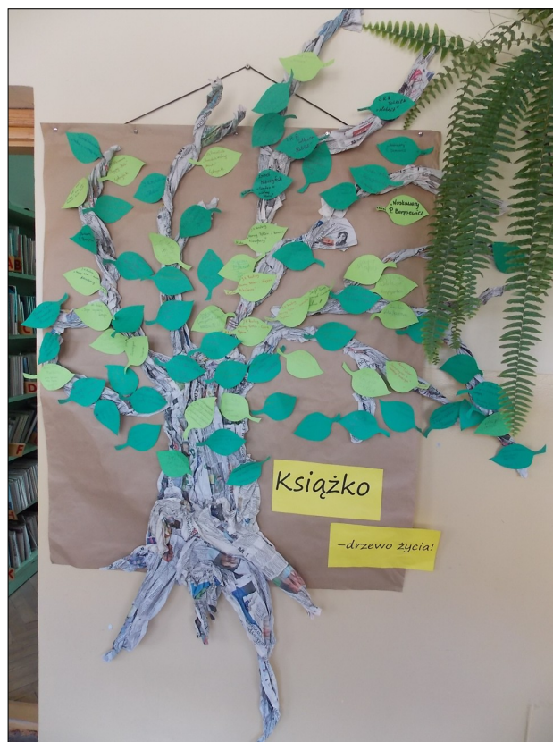
Po... :) )

Dlaczego ludzie tak rzadko żyją samotnie? Jakie są wady i zalety mieszkania w pojedynkę. Kiedy jest łatwiej, a kiedy trudniej? O swoich przemyśleniach mogły opowiedzieć pierwszaki na zajęciach bibliotecznych .