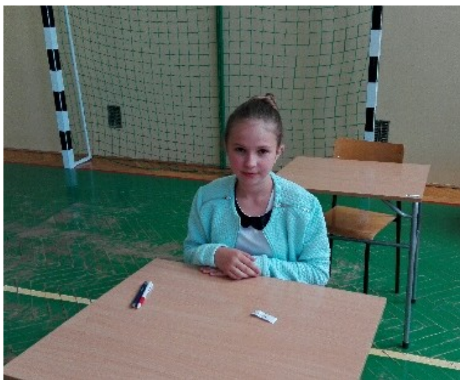
Tuż przed testem